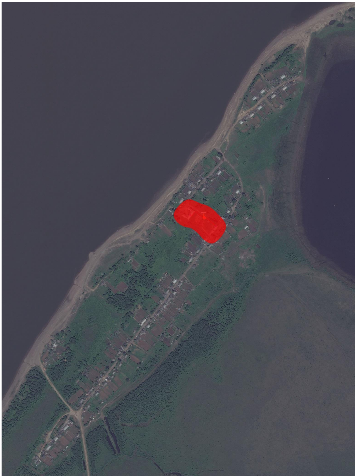
Рис. 2.2 – Зона действия системы теплоснабжения п. Быстринск.