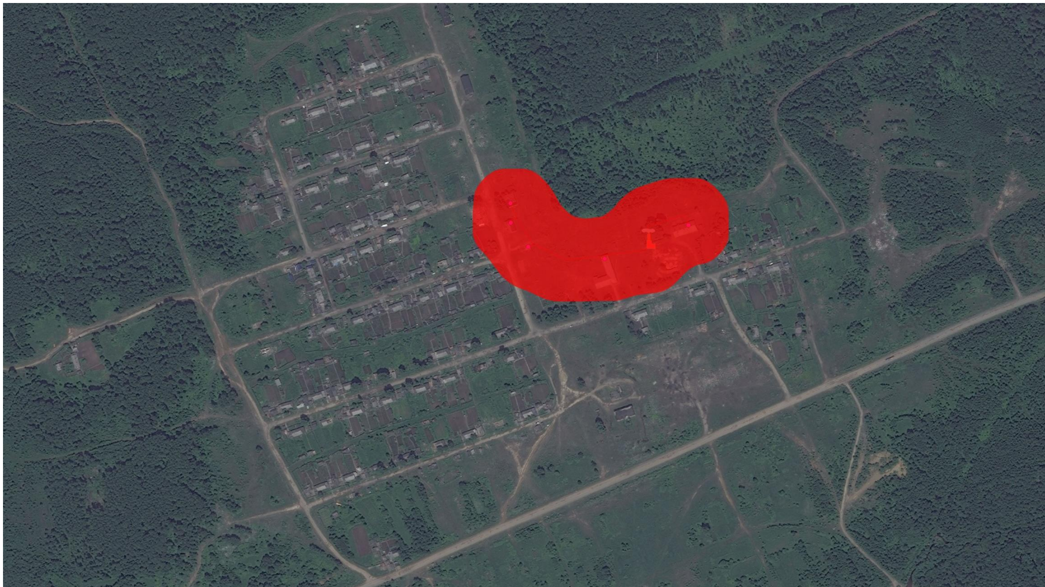
Рис. 2.1 – Зона действия системы теплоснабжения п. Решающий.